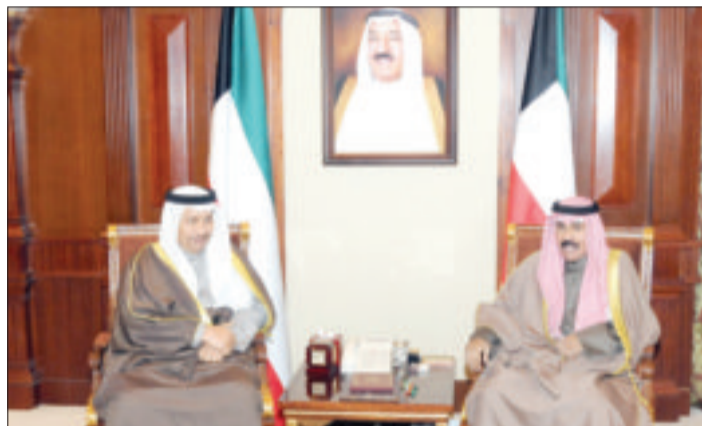
ولي العهد مستقبلاً المبارك