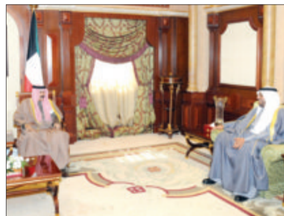
... ووزير الدفاع

استقبل سمو ولي العهد الشيخ نواف الأحمد، في قصر بيان صباح أمس، رئيس مجلس الأمة مرزوق الغانم. كما استقبل سمو ولي العهد، سمو الشيخ جابر المبارك. والتقى سمو ولي العهد، سمو رئيس مجلس الوزراء الشيخ صباح الخالد. واستقبل سموه على التوالي: نائب رئيس مجلس الوزراء وزير الدفاع الشيخ أحمد المنصور، ونائب رئيس مجلس الوزراء وزير الخارجية وزير الدولة لشؤون مجلس الوزراء أنس الصالح، ووزير الخارجية الشيخ الدكتور أحمد الناصر، ووزير النفط وزير الكهرباء والماء الدكتور خالد الفاضل، حيث قدم لسموه وكيل وزارة النفط الشيخ الدكتور نمر الفهد، بمناسبة تعيينه في منصبه الجديد.