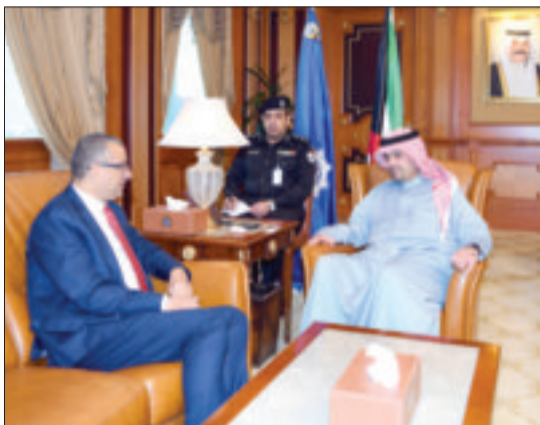
... والسفير التونسي

استقبل نائب رئيس مجلس الوزراء وزير الداخلية أنس الصالح في مكتبه بمقر وزارة الداخلية أمس على التوالي: سفير الجمهورية التونسية أحمد بن الصغير، وسفير جمهورية ألمانيا الاتحادية شتيفان موبس، وسفير الاتحاد الأوروبي كريستيان تيودور، والسفير الإيطالي كارلو بالدوتشي. وبحث الصالح خلال اللقاءات الموضوعات ذات الاهتمام المشترك، لاسيما المتعلقة بالجوانب الأمنية. وتوجه السفير التونسي بالشكر والتقدير لدولة الكويت، مرحباً بزيارة الصالح إلى دولة تونس لحضور فعاليات الدورة السابعة والثلاثين من اجتماع وزراء الداخلية العرب، مثنياً الرعاية الكريمة التي تحظى بها الجالية التونسية في بلدها الثاني الكويت. وأعرب السفير الإيطالي عن تقديره العميق لدولة الكويت، ودورها المتميز في خدمة السلم والأمن.