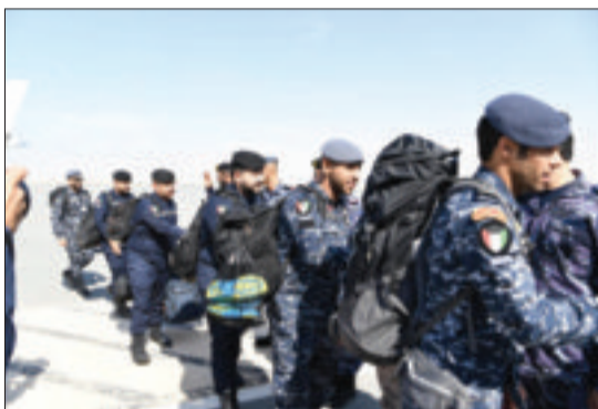
القوات المشاركة في التمرين لدى وصولها إلى الإمارات