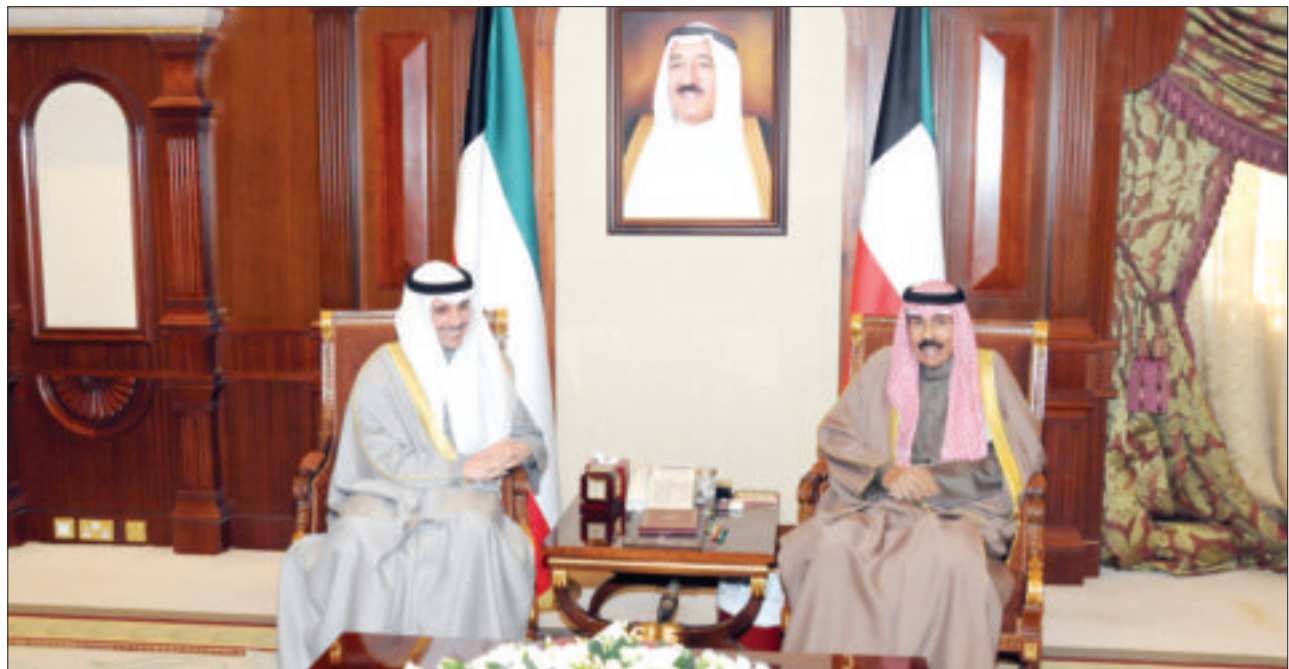
ولي العهد مستقبلاً الغانم

استقبل نائب رئيس مجلس الوزراء وزير الداخلية أنس الصالح في مكتبه بمقر وزارة الداخلية أمس على التوالي: سفير الجمهورية التونسية أحمد بن الصغير، وسفير جمهورية ألمانيا الاتحادية شتيفان موبس، وسفير الاتحاد الأوروبي كريستيان تيودور، والسفير الإيطالي كارلو بالدوتشي. وبحث الصالح خلال اللقاءات الموضوعات ذات الاهتمام المشترك، لاسيما المتعلقة بالجوانب الأمنية. وتوجه السفير التونسي بالشكر والتقدير لدولة الكويت، مرحباً بزيارة الصالح إلى دولة تونس لحضور فعاليات الدورة السابعة والثلاثين من اجتماع وزراء الداخلية العرب، مثنياً الرعاية الكريمة التي تحظى بها الجالية التونسية في بلدها الثاني الكويت. وأعرب السفير الإيطالي عن تقديره العميق لدولة الكويت، ودورها المتميز في خدمة السلم والأمن.