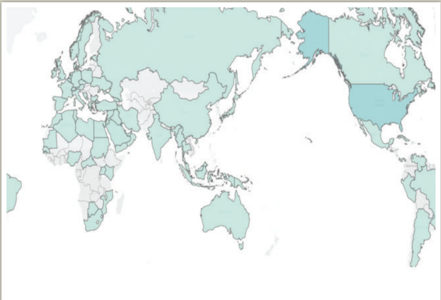
خريطة تبين الدول التي صدرت منها التغريدات

72 حساباً تصنف نفسها بأنها خدمات أو مواقع إخبارية تابعت الهاشتاغ 21 منها فقط ذكرت أنها مرخصة